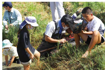
小さな虫も見逃さない

9月23日の午前中、与那国駐屯地にあるビオトープで昆虫学習会を開催しました。事前に大人10名と子ども21名の予約がありましたが、観察会を始めるとさらに大人3名と子ども10名が増えていて、合計43名の参加があり大盛況でした。慣れていくと、ほとんどの子が池に入って、水網で虫を捕まえていました。池の中からトビイロゲンゴロウ、ウスイロシマゲンゴロウ、ミナミヒメガムシ、ショウジョウトンボのヤゴ、イトトンボのヤゴ、マツモムシ、コマツモムシ、アメンボなどを捕まえて、池の周辺ではギンヤンマや大陸から風に乗って飛来したスネアカネというトンボが飛んでいました。専門の先生から「アメンボの名前の由来は飴の匂いがするから」と実際に匂いを嗅ぎながら説明を聞くと、その匂いに驚いていました。