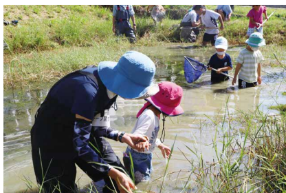
慣れてきたらザブザブ入る