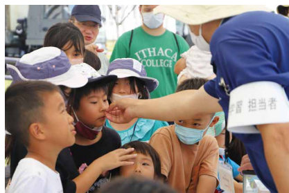
アメンボは飴の匂い