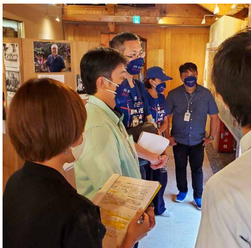
館内展示をご案内

10 月 7 日、魏嘉賢花蓮市長一行が DiDi 与那国交流館を訪れました。一行は町主催による植樹式の後、館内を見学。館内では、事務局長による展示案内の他、同館が取り組んでいる台湾華語講座の取り組みが紹介されました。