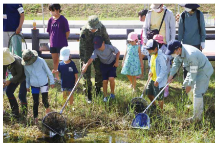
開始直後はみんなドキドキ