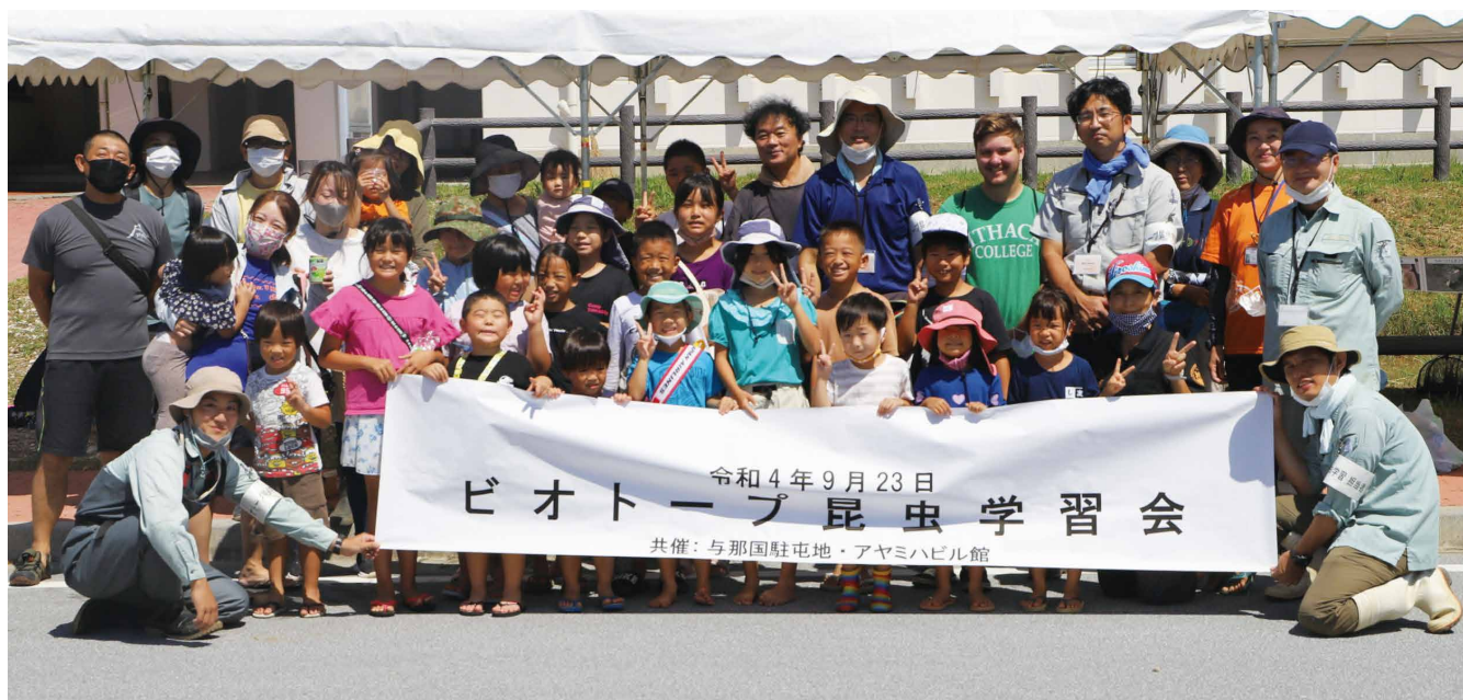
最後はみんな「よーなーぐーにー」