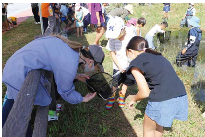
とったの、見てみて