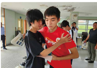
別れの時、両町のきずなを いっそう深めていってほしい