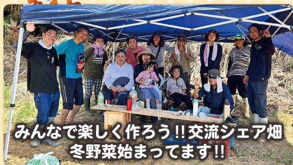
みんなで楽しく作ろう!! 交流シェア畑 冬野菜始まっています!!

「みんなで楽しく作ろう交流シェア畑!!」 プロジェクト冬野菜始まっています!! 交流事業として令和4年 「みんなで楽しくつくろう交流拠点」の第二弾、 今度はシェア畑で交流しましょう!! 移住者や住民の方、更には移住を検討している方、 みんなで野菜を作って食べて交流しませんか!!!?