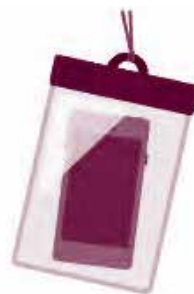
携帯は防水パックに

※沖縄県では、漁業者以外の方が採る事を禁止されている魚介類や使用が禁止されている漁具・漁法が定められていますので、事前に漁業協同組合や沖縄県水産課のホームページなどで確認してください。