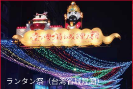
ランタン祭(台湾省城隍廟)