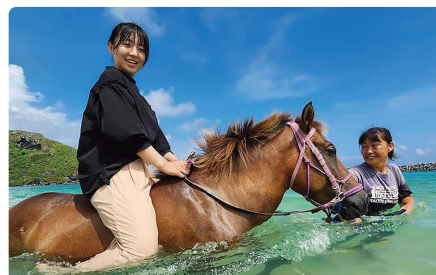
青く澄んだ海で与那国馬と遊びました。 8月の最高気温が22～23℃の礼文には、海水浴の経験がほとんどない子も多い。