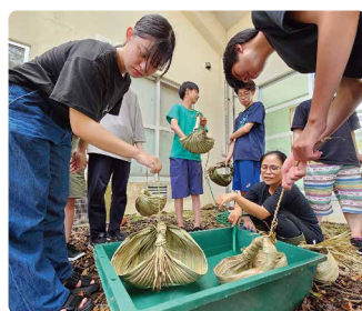
クバの葉でウプルを作って、実際に水が汲めるか試してみました。