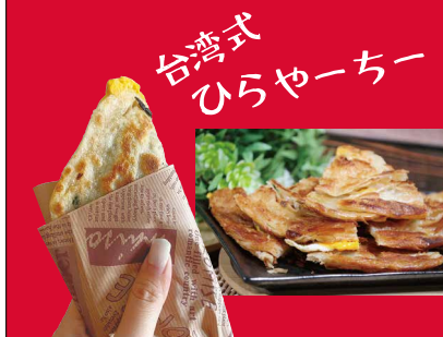
台湾式 ひらやちー