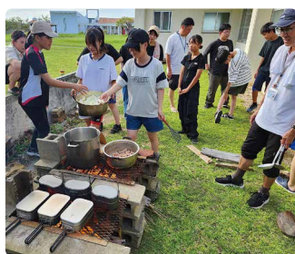
野外炊飯で両校の生徒が協力してかまどを組み、カレーを作りました。