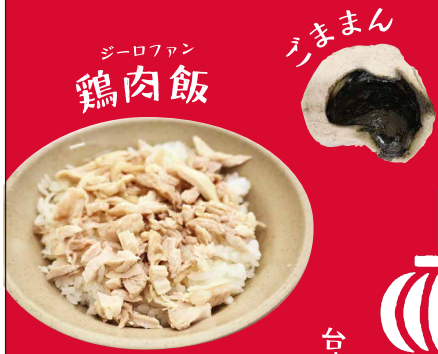
ジローファン 鶏肉飯