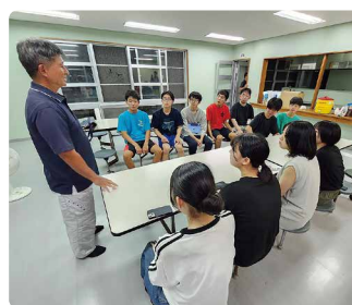
星空観察の前に星のお話し。 緯度が大きく異なる礼文と与那国では星空の様子も大きく異なります。