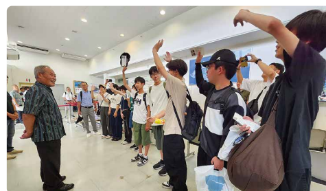
また与那国に來たい人！ 全員で、はいー！！