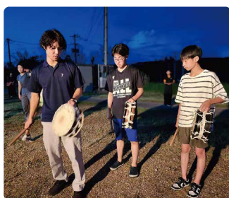
祖納青年会のエイサー練習に参加、与那国のお盆の文化について学びました。