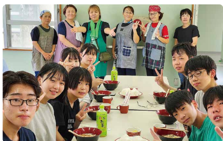
島料理づくりを指導してくれた女性連合会のみなさんと。