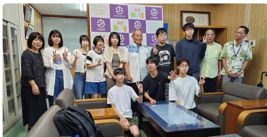
最北の島から真夏の与那国へ。 体調管理には十分気をつけて与那国を満喫して下さいと町長。

コロナ禍を乗り越えた今、今後は教育、文化、産業、人材育成など、幅広い分野での新たな友好交流に夢が広がります。その第一歩として、8月7～9日2泊4日の行程で礼文町の中学生9名（男子5名、女子4名）を与那国町に迎え入れ、与那国中学校の生徒5名（男子2名、女子3名）と宿泊交流を行いました。新しい仲間や異文化との出会いやかかわりが、今後の交流を深める良いきっかけとなりますように。