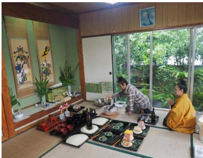
ンディマチリ 平成27年12月14日(旧11月4日甲子)