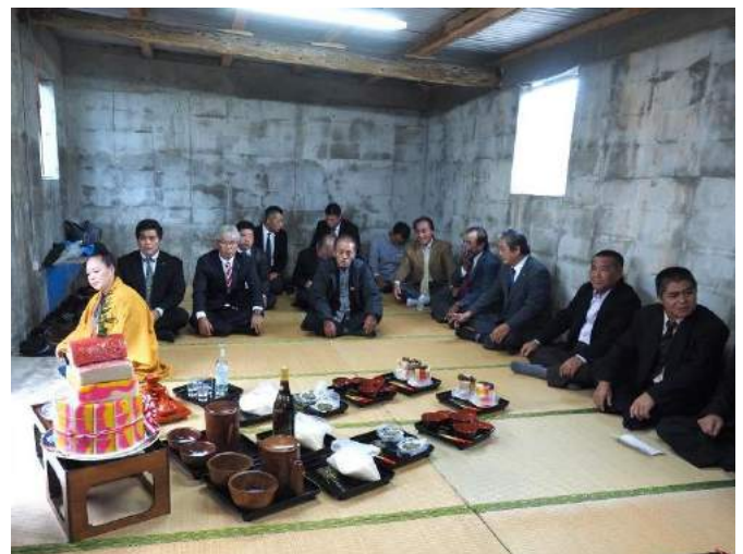
ندانマチリ 平成28年1月2日(旧11月23日壬午)