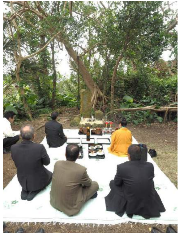
ンマナガマチリ 平成28年1月1日(旧11月22日壬午)