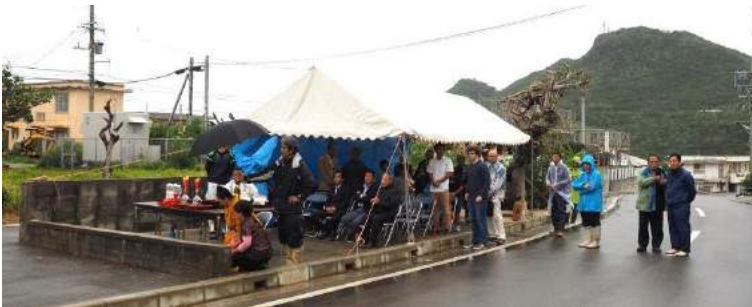
クブラマチリ 平成27年12月10日(旧10月29日庚申)

今年も自治公民館活動に対し、ご理解とご協力を賜りますよう宜しくお願い申し上げます。