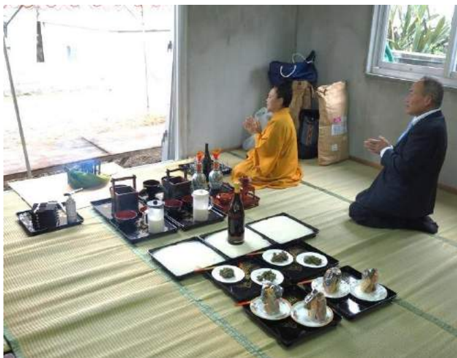
ウマチリ 平成27年12月11日(旧11月1日辛酉)