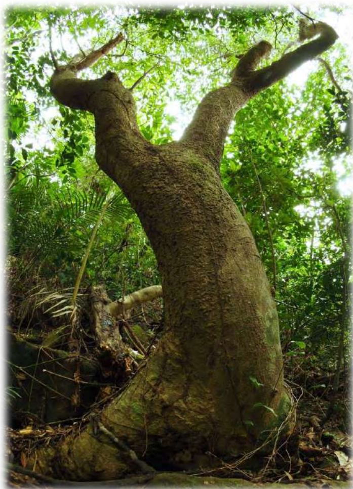
タイワンオガタマの大木 平成30年1月

現在、世界自然遺産登録を目指している西表島であるが、かつては周辺離島のみならず、沖縄県内における木材の一大供給地であった。