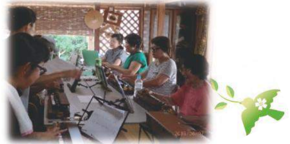
[写真は花ゆりサロンでの大正琴開催風景]

上記の件で、ご不明な点がございましたらお気軽に与那国町地域包括支援センターまで、ご連絡ください。