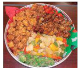
毎年恒例の一品持ち寄り(久部良保育所)