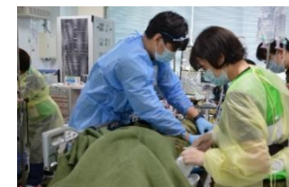
日米共同衛生訓練