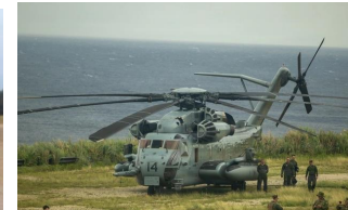
米CH-53による物資輸送等