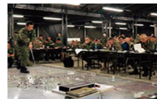
日米共同調整所の運営