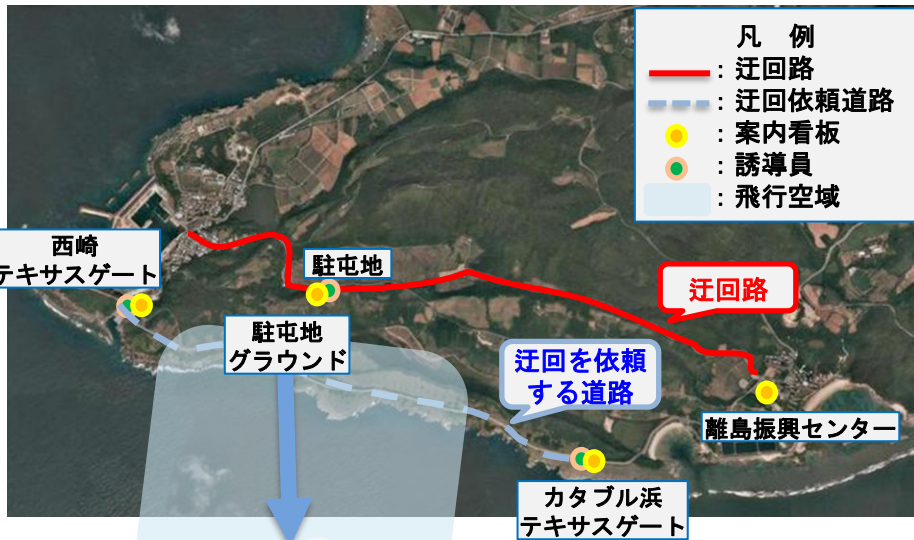
巡回バス路線変更図